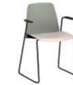
Sled frame armchair Sillón con base trineo