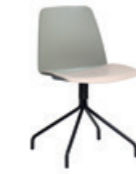
Steel swivel base Base giratoria de acero