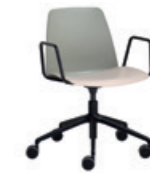
Aluminum swivel base Base giratoria de aluminio + arms / brazos + casters / ruedas