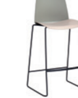
Sled frame stool Taburete base trineo high / alto