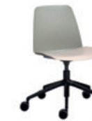
Aluminum swivel base Base giratoria de aluminio + casters / ruedas