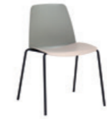
4 leg frame Pie 4 patas