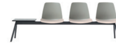
Bench 2-5 seater Banco 2-5 plazas