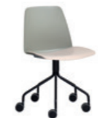
Steel swivel base Base giratoria de acero + casters / ruedas