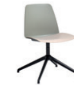
Aluminum swivel base Base giratoria de aluminio