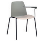
4 leg frame Pie 4 patas + writing tablet / pala escritura