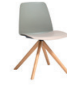
Wooden swivel base Base de madera giratoria