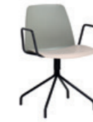
Steel swivel base Base giratoria de acero + arms / brazos