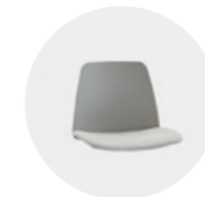
Upholstered seat Asiento tapizado