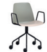
Steel swivel base Base giratoria de acero + arms / brazos + casters / ruedas