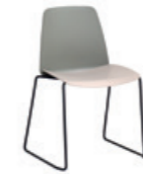
Sled frame Base trineo