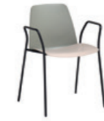
4 leg armchair Sillón con 4 patas