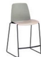
Sled frame stool Taburete base trineo medium / medio