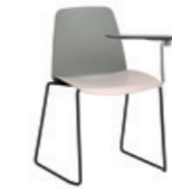
Sled frame Base trineo + writing tablet / pala escritura