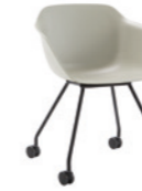
– 4 leg frame Pie 4 patas + casters / ruedas