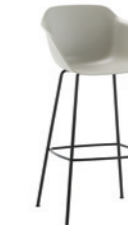
– 4 leg frame armchair Sillón 4 patas high / alto