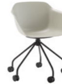
– 5 spoke steel swivel base Base giratoria de 5 radios + casters / ruedas