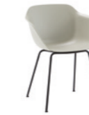
– 4 steel leg frame Pie 4 patas de tubo