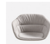
– Upholstery monoshell soft Carcasa tapizada soft