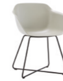
– Sled frame Base varilla