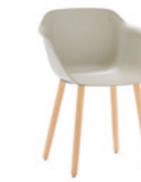
– 4 wooden leg frame Pie 4 patas de madera