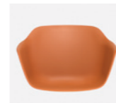
– Plastic monoshell Carcasa de plástico