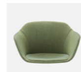
– Upholstery monoshell Carcasa tapizada