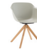
– 4 spoke wooden swivel base Base giratoria 4 radios de madera