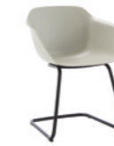
– Cantilever base Pie patín