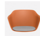
– Plastic monoshell + upholstered seat Carcasa de plástico + asiento tapizado