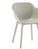
– 4 plastic leg frame Pie 4 patas de plástico