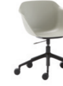
– 5 spoke aluminum swivel base Base giratoria de 5 radios de aluminio + casters / ruedas + gas lift / gas