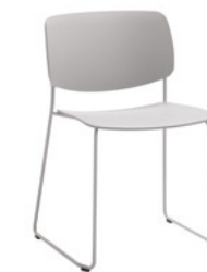
Sled frame Base trineo