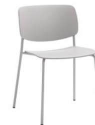
4 leg frame Pie 4 patas