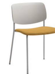
Upholstered seat Asiento tapizado